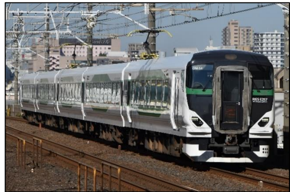
高崎線 実演列車のイメージ