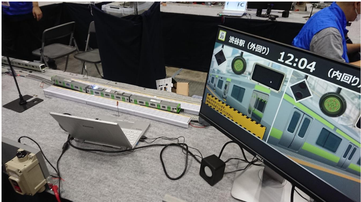
山手線ゲーム 2nd のようす(国際鉄道模型コンベンション)

今回は、『山手線ゲーム & RFC ダイヤ運転フェスタ in てっぱく』と題し、以前より好評いただいている体験型の『山手線ゲーム 3rd』と実演型の『高崎線ダイヤ運転』を実施します。